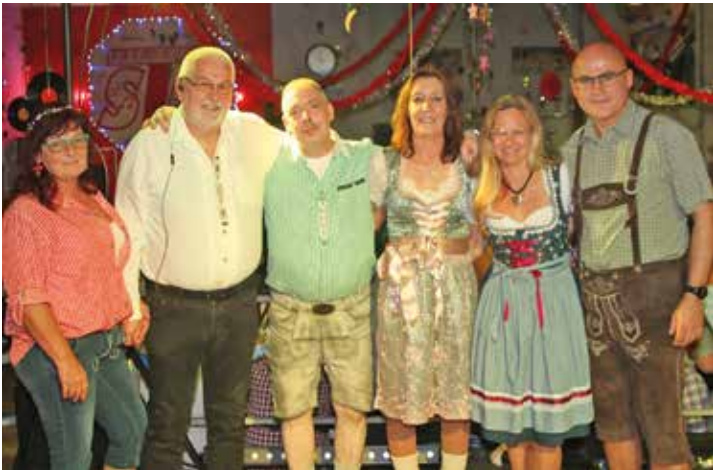
Das Königshaus der Geistenbecker St. Josef Schützenbruderschaft beim Oktoberfest der Showtrompeten