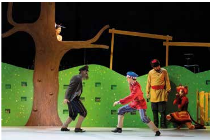
Das Ballettmärchen Peter und der Wolf