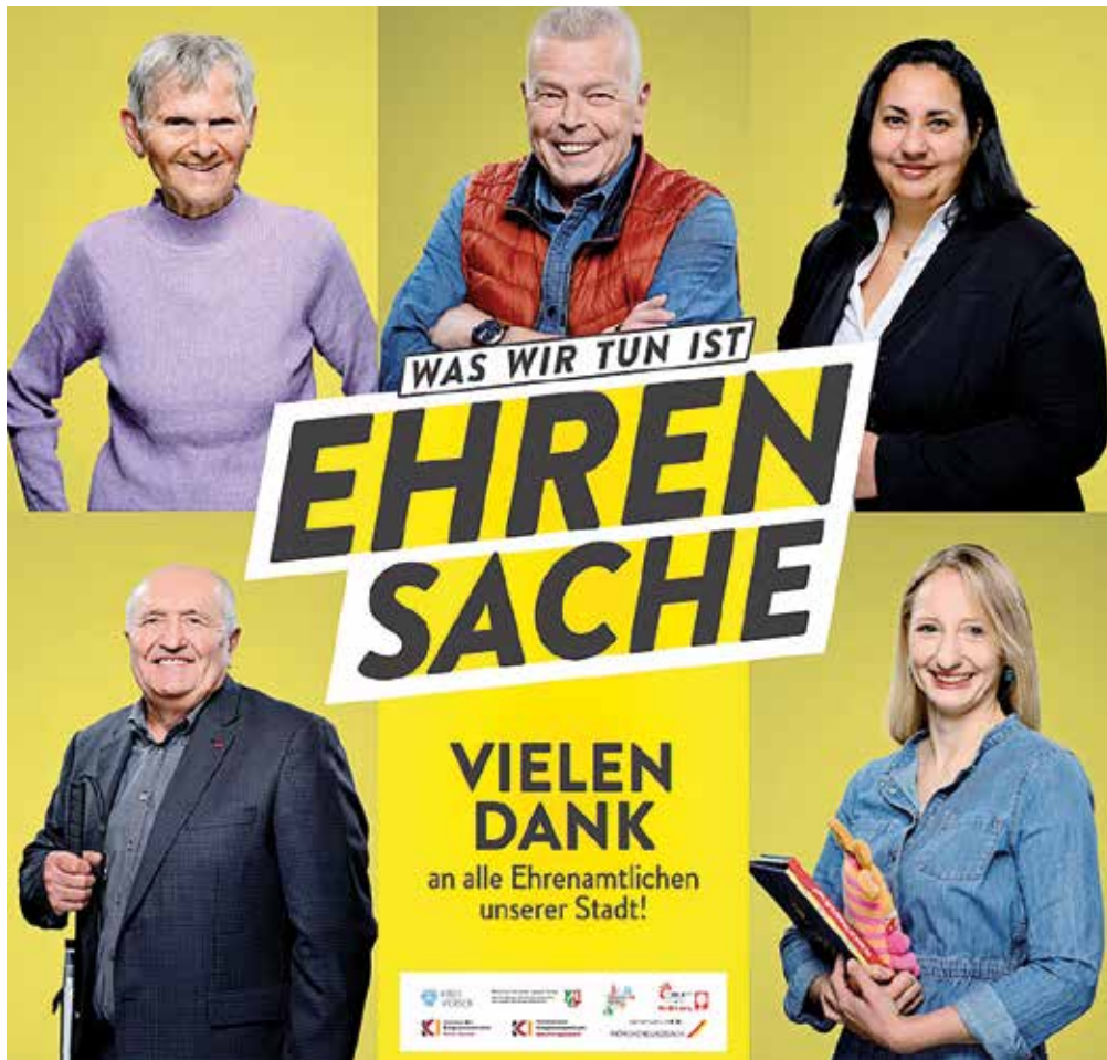
Ehrenamtler, die auf Bussen der NEW stellvertretend für Viele dargestellt werden