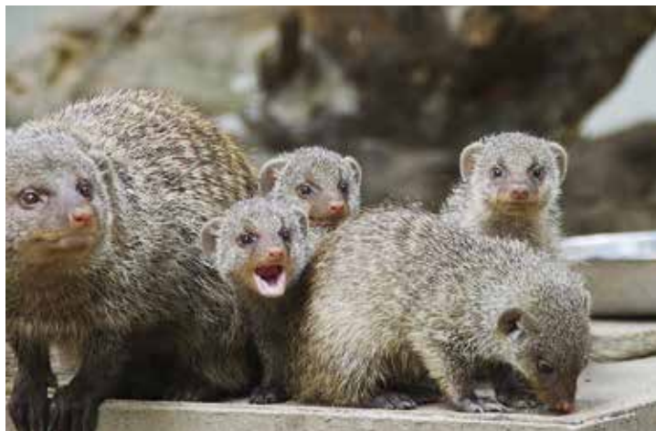
Zeboramangusten ( Mungos mungo ) sind eine Raubtierart aus der Familie der Mangusten. Sie sind in weiten Teilen Afrikas südlich der Sahara verbreitet. Sie leben in Gruppen von meist 10 bis 20 Tieren und haben ein ausgeprägtes Sozialverhalten. Zu ihrer Nahrung gehören überwiegend Insekten und andere Kleintiere.

In Kooperation mit dem Heimatverein Odenkirchen werden für die Anwesenden Liedblätter verteilt und der Platz vor der Kirche mit Kerzen illuminiert. Bei Regenwetter oder Sturm findet das Event in der Kirche statt. Info: Ev. Kirchengemeinde Odenkirchen