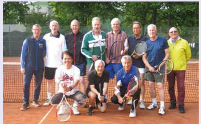
Herren 60-Mannschaft des OTC