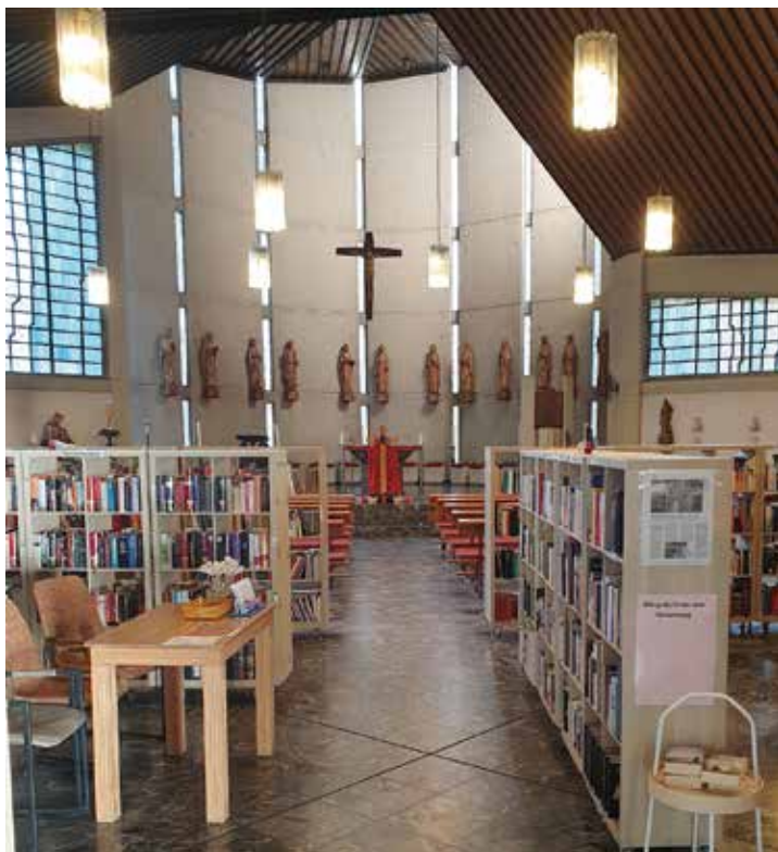
Die Bücherkirche hat drei Tage in der Woche geöffnet