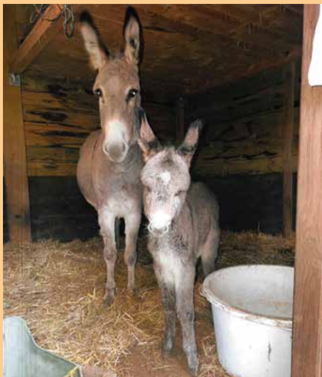
Auf dem Rittergut Wildenrath gab es kürzlich Eselnachwuchs: Das kleine Eselchen, es ist ein Mädchen, wurde Pauline getauft und ist mittlerweile schon in der ganzen Nachbarschaft bestens bekannt. Info und Foto: Hans-Ludwig Hoffmann