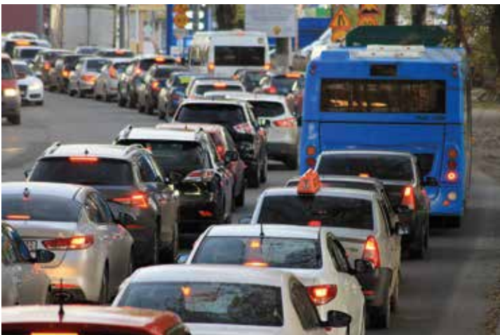
Die Stadtverwaltung hat die Kfz-Zulassungen für 2023 veröffentlicht