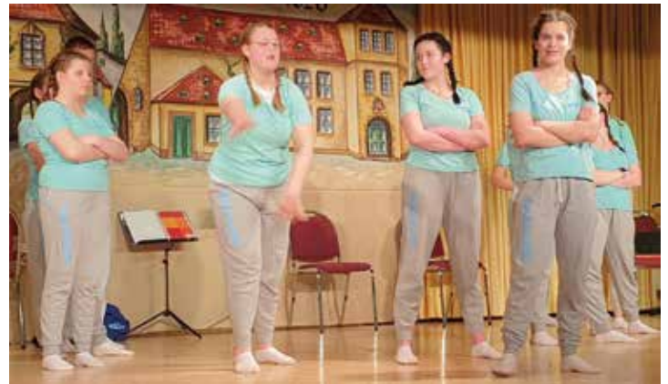
Mitglieder der Sparkling Dancers