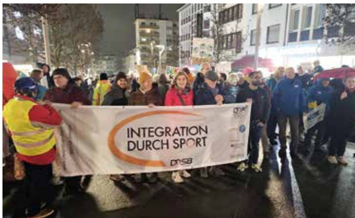
Unter anderem hatte auch der Stadtsportbund zur Teilnahme an der Demonstration aufgerufen. Er steht insbesondere für eine Integration durch Sport und für das Miteinander von allen Menschen bei Spiel, Spaß und Bewegung!

Am 25. Januar fand in Mönchengladbach eine Demonstration gegen Rechtsextremismus statt. Dazu hatte das Bündnis „Mönchengladbach stellt sich quer“ (MSSQ) aufgerufen. Dieses setzt sich aus politischen Parteien, Religionsgemeinschaften, diversen Verbänden und Organisationen sowie auch Einzelpersonen zusammen. Anfangs gingen die Organisatoren von ca. 350 Teilnehmenden aus. Schließlich waren es aber nach Polizeiangaben etwa 5.000 Menschen, die Veranstalter gingen sogar von 7.000 aus, die gegen Fremdenfeindlichkeit, Faschismus und für die Demokratie in Deutschland auf die Straße gingen.