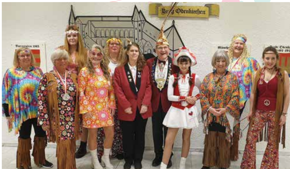
Der Elferrat der KG Ruet-Wiss-Okerke