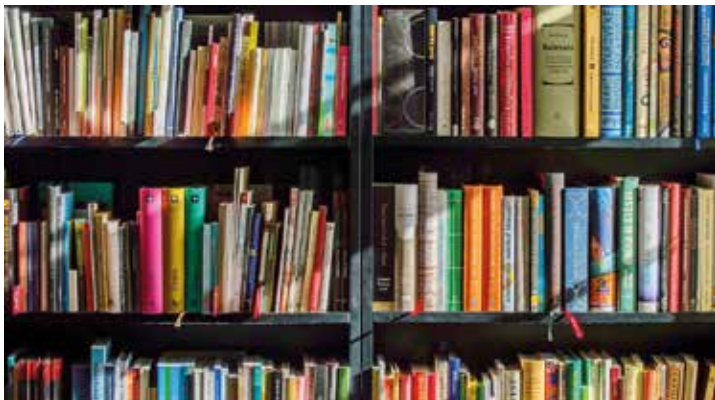
Am Rosenmontag und Veilchendienstag haben die Mönchengladbacher Bibliotheken geschlossen

Zu Weiberkarneval sind die Zentralbibliothek im Carl-Brandts-Haus, die Stadtteilbibliothek Rheydt sowie die Schul- und Stadtteilbibliotheken in Rheindahlen zu den üblichen Zeiten geöffnet. Die beiden Erstgenannten können am Karnevalswochenende, sowohl samstags wie auch sonntags, normal genutzt werden. Die Schulbibliothek in Giesenkirchen ist am 8. Februar (Weiberkarneval) sowie dem folgenden Freitag geschlossen. Am Rosenmontag (12.2.) und Veilchendienstag (13.2.) sind alle Bibliotheken zu. An der Außen-Rückgabe der Zentralbibliothek können aber auch an den jecken Tagen rund um die Uhr Medien zurückgegeben werden.