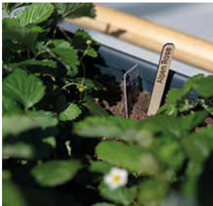
Saat leihen, säen, Saat zurückgeben – das ist nun in der Saatgut-Bibliothek möglich

D er Erhalt von Saatgut-Kultur und die Stärkung von Biodiversität sind das Ziel dieser Einrichtung. Sie ist u. a. auch unter dem Aspekt zu sehen, dass ca. 90% der Nutzpflanzenvielfalt in unseren Breiten bereits unwiderruflich verloren gegangen sind. Demzufolge werden alle Hobbygärtnerinnen und -gärtner aufgerufen, die noch vorhandenen Sorten durch Vermehrung und Verbreitung zu erhalten. Hierzu können sie Saatgut aus der Bibliothek ausleihen, es bei sich einpflanzen, pflegen, ernten, neues Saatgut gewinnen