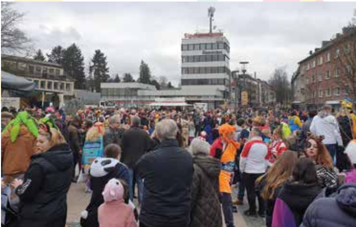
Auf dem Marktplatz wie auch der Burgfreiheit warteten viele gut Gelaunte