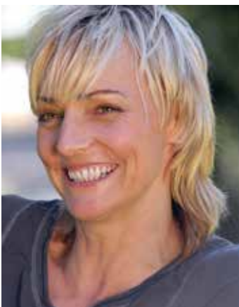
Heike Drechsler, ehemalige DDR-Leichtathletin, die u. a. 1992 und 2000 Olympiasiegerin im Weitsprung wurde

Am 19. März sind im Hugo-Junkers-Hangar im Rahmen einer Talk-Runde die beiden Olympia-Siegerinnen Heike Drechsler und Malaika Mihambo zu Gast. Die Veranstaltung, die vom Initiativkreis Mönchengladbach organisiert wird, beginnt um 20.00 Uhr und steht unter dem Titel „Sprungweiten“. Talkmaster ist der ZDF-Moderator Jochen Breyer.