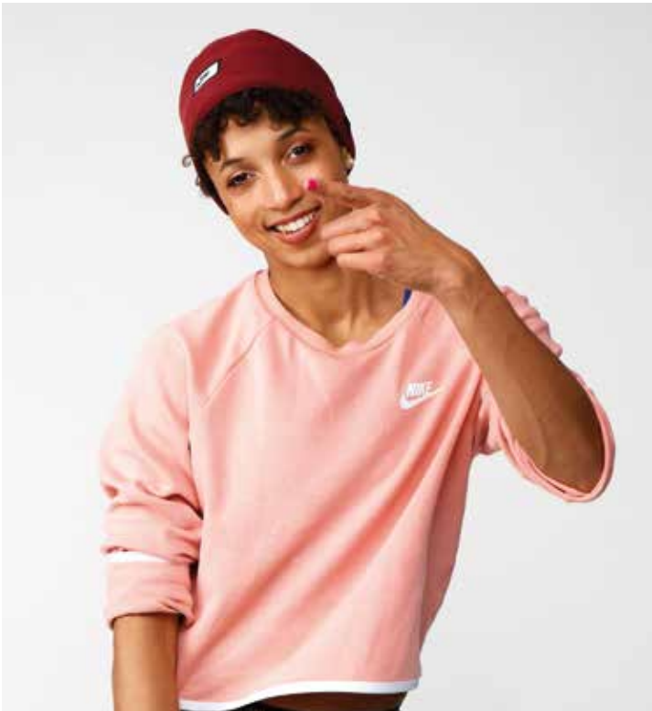
Malaika Mihambo, deutsche Leichtathletin und 2019 sowie 2022 Weltmeisterin im Weitsprung wie auch 2021 Olympiasiegerin in dieser Disziplin