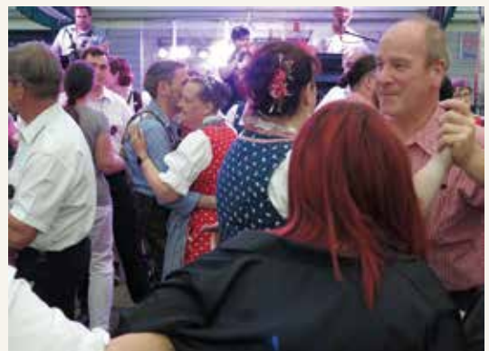
Beim Klompenball ging es hoch her