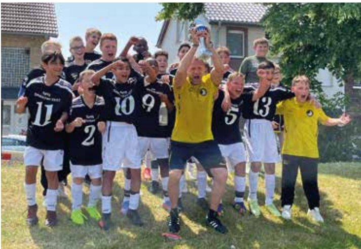
Nach einer anstrengenden, jedoch sehr positiven Saison in der Niederrheinspielrunde holte die U13 der Spielvereinigung auch noch den Stadtmeistertitel

In einem spannenden und weitgehend ausgeglichenen Endspiel um die Mönchengladbacher Stadtmeisterschaft konnte die U 13 der SpVg den Titel schließlich für sich erringen. Sie musste dabei auf dem Giesenkirchener Platz gegen die Mannschaft des 1. FC Mönchengladbach antreten. Nachdem sie schon früh in Rückstand geriet, konnte sie diesen aber noch in der ersten Halbzeit ausgleichen. Schließlich stand auch nach Ablauf der Spielzeit noch kein Sieger fest, sodass es zum 9-Meter-Schießen kam. Hier hatten die Odenkirchener eindeutig das bessere Ende für sich: Zum einen verwandelten sie alle ihre Strafstoße und zum anderen wurden auch noch zwei gehalten. Auf diese Weise konnte die Mannschaft letztendlich verdienter Stadtmeister werden.