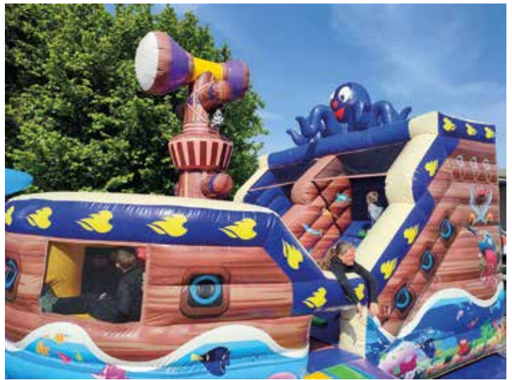
Die Hüpfburg war der Hit bei den kleinen Besuchern des 16. Vatertagstreffens der Odenkirchener Showtrompeten