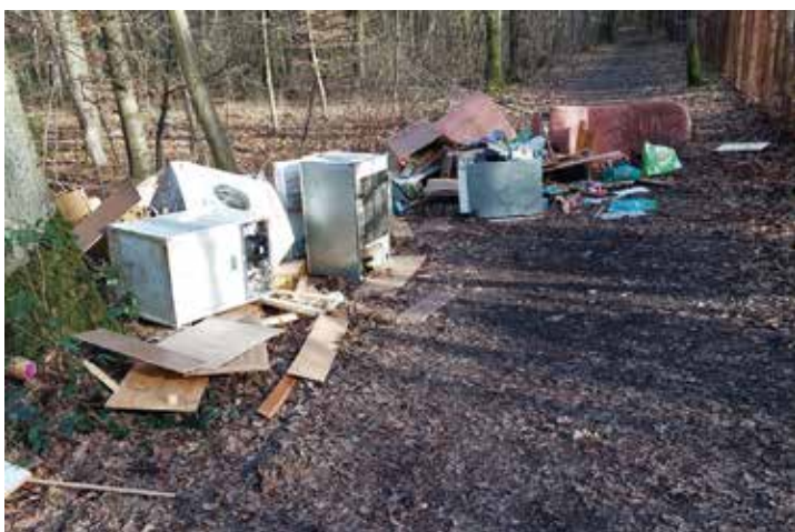
Illegal entsorgter Müll am Birkmannsweg in Hardt