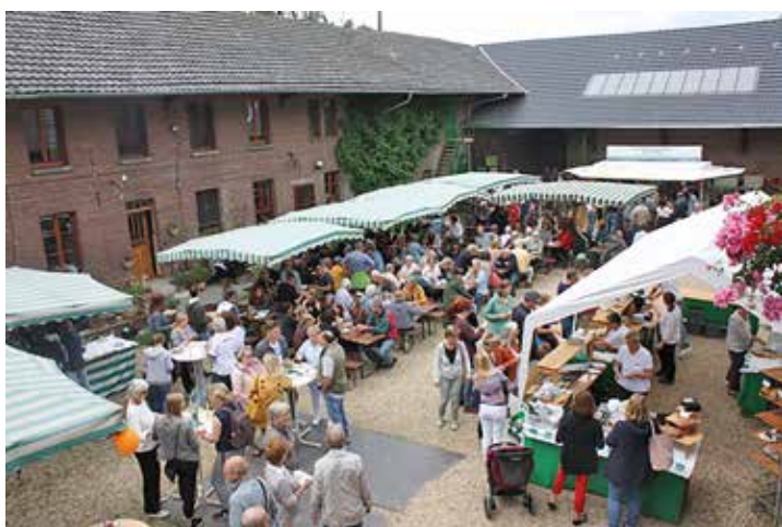
Am 18. Juni 2023 ab 11 Uhr lädt der Lenßenhof wieder zum Hoffest und begeht dabei dieses mal sogar das 30-jährige Bioland-Jubiläum. Auch in diesem Jahr wird es diverse Stände mit frisch geerntetem Obst und Gemüse und mit allgemeinen Informationen sowie speziellen zu den angebauten Produkten geben.

Den Lenßenhof im Internet findet man unter www.lenssenhof.de .